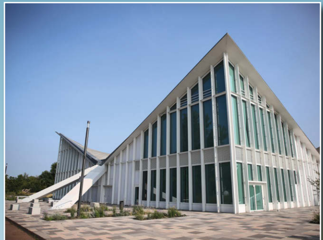
Die Hyparschale in Magdeburg: Es gibt wohl kaum einen cooleren Tagungsort als die 1969 errichtete, 2024 sanierte und direkt an der Elbe gelegene Halle.

Du bist bereits Prophylaxe-Profi? Dann schaff' dir Freiräume durch deinen eigenen Verantwortungsbereich und investiere in dich und deine Fähigkeiten. Wir geben dir den wirtschaftlichen Background und machen dich zur Prophylaxe-Managerin. In diesem Seminar führen wir dich durch den Prophylaxealltag und definieren die Basis deiner Prophylaxe neu – wirtschaftlich und organisatorisch: von der Anamnese bis zur Zahlung. Eine wirtschaftliche und hochwertige Prophylaxe orientiert sich am Praxiskonzept und bietet den Patientinnen und Patienten individuelle Betreuung. Dazu benötigt es ein Prophylaxe-Konzept und organisatorische Vorbereitungen. Das erarbeiten wir mit dir zusammen.